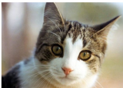
Figuur 1: Een kat